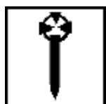
LES FRERES D'ARMES

Clergé officiel, l'Orthodoxie définit le dogme et l'impose à travers l'Univers. Se fondant entièrement sur l'Evangile Omega, elle n'admet pas les interprétations des textes : seuls les conciles peuvent se déterminer à ce sujet. Dans ses rangs, elle accueille à la fois le curé de campagne et l'évêque politicien. Le Patriarche, chef suprême de l'Eglise, est généralement issu de l'Orthodoxie.