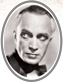
Le Dragon Zerdin

La Livonie est, depuis des temps immémoriaux, une terre Fae.