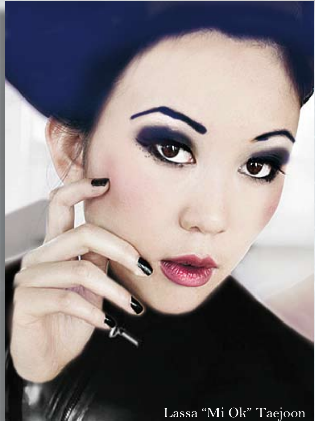
Lassa "Mi Ok" Taejoon

Les PJ aboutissent, par un ascenseur en état de marche, dans une salle circulaire au sol en verre. Sous leurs pieds, une trentaine de filles biosculptées, transexuelles et exotiques sont étalées comme des poupées de chair dans leurs tubes de verre, filmées et retransmises sur de grands écrans tri-di qui parsèment la salle. Plusieurs clients sont occupés à faire leurs choix, les auscultant sur les écrans numériques. Mi Ok permettra aux PJ de choisir dans ce catalogue tri-di de très belles poupées prêtes à l'emploi, tatouées, biosculptées, etc. Le prix oscille entre