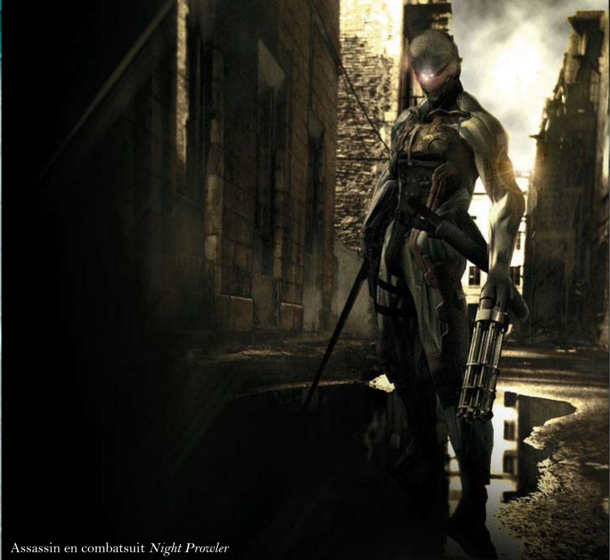
Assassin en combatsuit Night Prowler

Il possède toutefois un antigène (qui peut être déclenché via le DataPool), dont le code est en possession de Sakuya Inaba . La tueuse va quitter le territoire de Night City pour rejoindre le Japon, le lendemain.